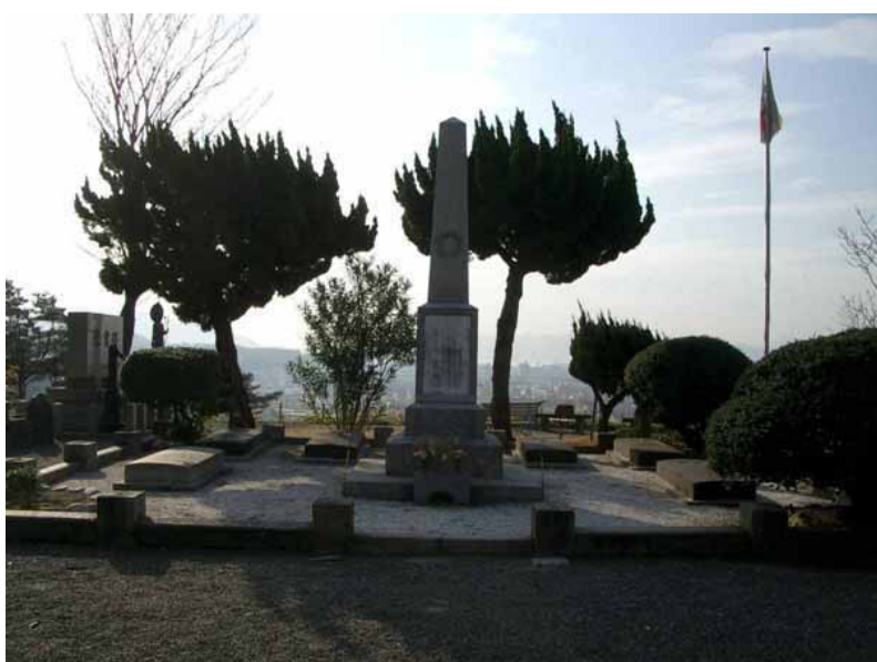
フランス人墓地全景

広島市の街地を見下ろす比治山の南端に立派な洋式の墓地がある（写真；フランス人墓地全景）。7基のキリスト教式の墓の中央には記念碑が建てられており、その正面にはフランス語で次のような碑文が刻まれている（写真：記念碑正面の碑文）。「1900年に広島で永眠した中国派遣軍のフランス兵士のことを記念して、また日本人が我らの同朋を献身的に治療してくれたことに感謝し、日本在住のフランス人が本国の Souvenir Français 協会と協力してこの碑を建立した」。墓地にはいつも花が供えられており、整然とした佇まいである。