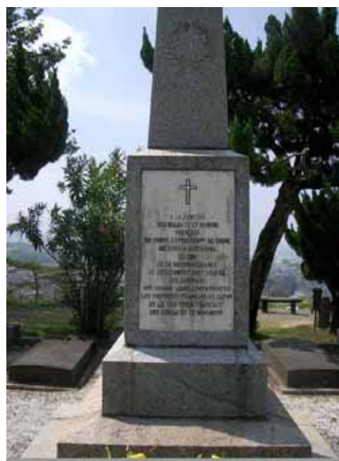
記念碑正面の碑文

この墓地は今から110年前、1900（明治33）年に造られたものである。同年、中国で起こった義和団の乱に際し、イギリス、フランス、ドイツ、アメリカ、イタリア、オーストリア、ロシア、日本の8か国が連合してこれの鎮圧にあたった。日本ではこれを北清事変と呼んでいる。その際、負傷したフランス兵120余名が日本に運ばれ、広島の陸軍病院で治療を受けた。大多数は治癒し帰国したが、そのうち7名は不幸にも広島の地で永眠した。彼らを埋葬するために比治山の陸軍墓地の一画、広島湾が見渡せるこの絶景の地が提供されたのである。