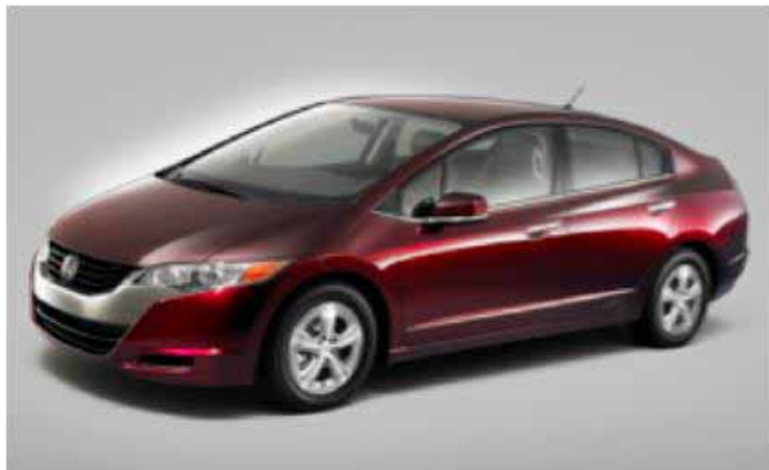
図4 . ホンダの燃料電池電気自動車 FCX クラリティー

1000 か所の水素ステーションの建設が計画されています。現在では耐久性の向上や低価格化などの課題も徐々に解決され、もはや、燃料電池電気自動車の出現は夢ではなくなってきました。因みに、現在の燃料電池車は、~1 億円と言われていますが、2015 年には、その 1/20 まで価格の値下げが可能であると見込まれています。