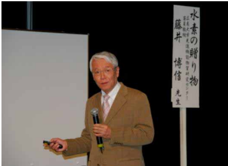
2011年3月15日、TSS文化大学で講演する著者

20世紀後半から始まった二酸化炭素ガス(CO 2 )の排出に伴う地球温暖化問題や化石燃料の枯渇に対処するため、水素をエネルギー媒体とする新しいクリーン・エネルギー・システムが提案されています。ここでは、水素エネルギーを将来どのように利用出来るのか皆様とともに考えてみましょう。