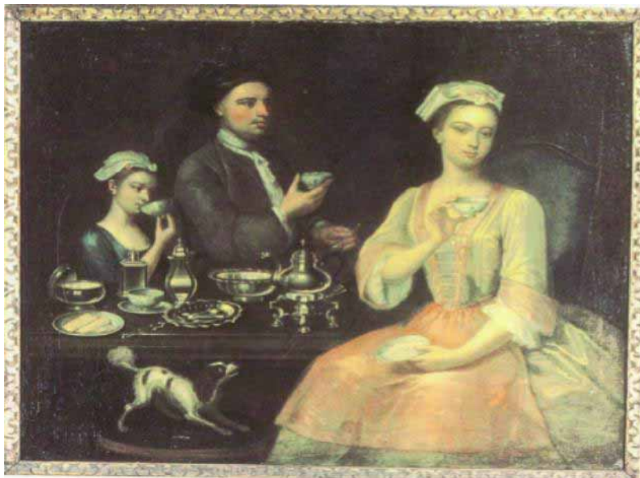
図2．初期の喫茶の風景：中国風の取手のない茶碗で飲んでいる。まるで薬を飲むみたいな真剣な顔つきである。（参考文献4より）

茶の風習が広まり、中国産の紅茶に西インド諸島産の砂糖を入れて中国製の磁器で飲むことが上流階級のステイタス シンボルになった。