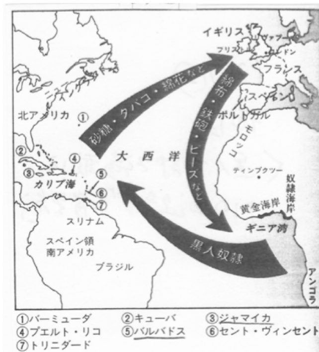
図3. 「三角貿易」 黒人奴隷を満載した中間航路（参考文献1より）

奴隷労働によって砂糖が大量生産され値段が大幅に安くなったことや、茶に対する輸入関税が引き下げられて茶の値段が安くなったことによって、18世紀中頃から後半にかけて紅茶の消費量は急激に増えた。国産のウェッジウッド磁器が誕生するのはその頃である。