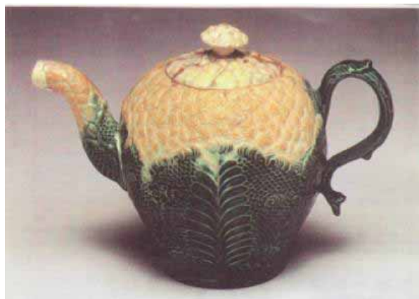
図4. ジョサイア・ウェッジウッドの代表作ティーポット（参考文献4より）

クリーム色のボーン チャイナ（骨灰入り磁器）で知られるウェッジウッド会社（2009年に経営破綻）であるが、ジョサイアが創業したのは1760年頃である。すでにオランダのデルフト焼やドイツのマイセン窯が知られていたが、ウェッジウッドは技術改良や機械化によって庶民向けの価格での製造を可能にした。