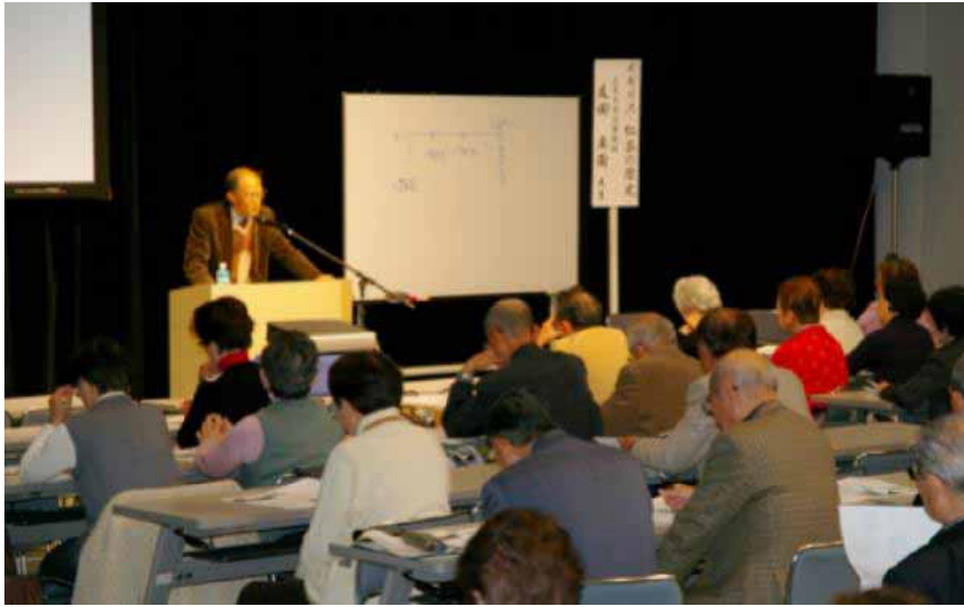
平成 22 年 12 月 21 日 TSS 文化大学で講演する筆者

イギリスといえば紅茶。紅茶といえばアフタヌーン ティー、そしてリプトン、トワイニング、ウェッジウッド……。茶樹・砂糖きびの生産地でない島国イギリスで紅茶が「国民的飲料」になるまでの 300 年の歩みを三段跳び（ホップ・ステップ・ジャンプ）に準えて跡づけてみたい。