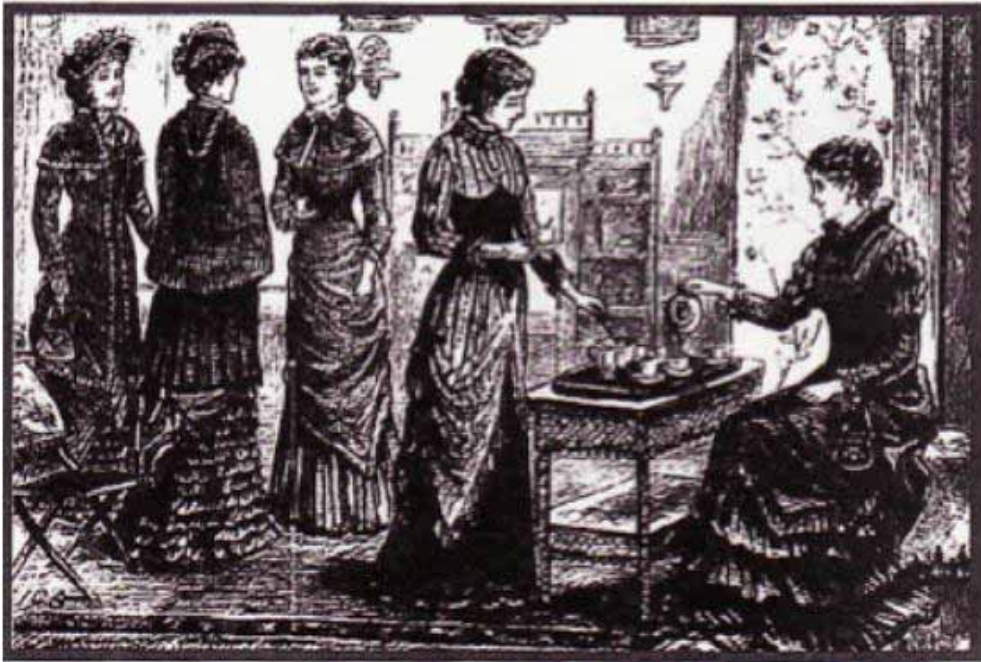
図5 . ティー パーティー：上流・中産の人びとのあいだにアフタヌーン ティーの習慣が定着するのは19世紀に入ってからである。（参考文献4より）

19世紀のイギリスでは、茶に砂糖とミルクを入れて飲むことが一般庶民の間にも浸透して、紅茶は次第に国民的飲料になる。1834年に東インド会社の中国貿易独占権が撤廃されて貿易が自由化されたことや、アヘン戦争（1840 - 42年）によって中国市場が開放されたために、安い値段の紅茶が大量に輸入されたからである。1800年頃と比べてイギリスへの茶の輸入は1841 - 61年の間に約2倍に増加している。