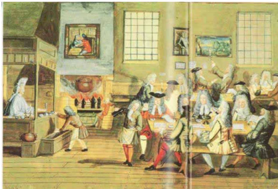
図1 .1700年頃の初期のコーヒーハウス:1ペンスの入店料を払うと、新聞を読んだり、トランプに興じたりなどでき、情報を交換する場でもあった。(参考文献4より)

ったが、次第に茶のほうが好まれるようになった。18世紀前半にかけて大流行したコーヒーハウスは、議論の場として、また情報センターとして大きな意義をもった。