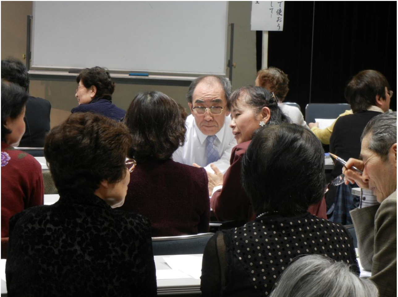
3人一組で話し合う受講生たち。写真中央は筆者・

聞き手の人は、話し手の方に顔を向けて、一生懸命聞いて、感想は、発言者のいちばん言いたいところに触れて、返すようにしてみてください。