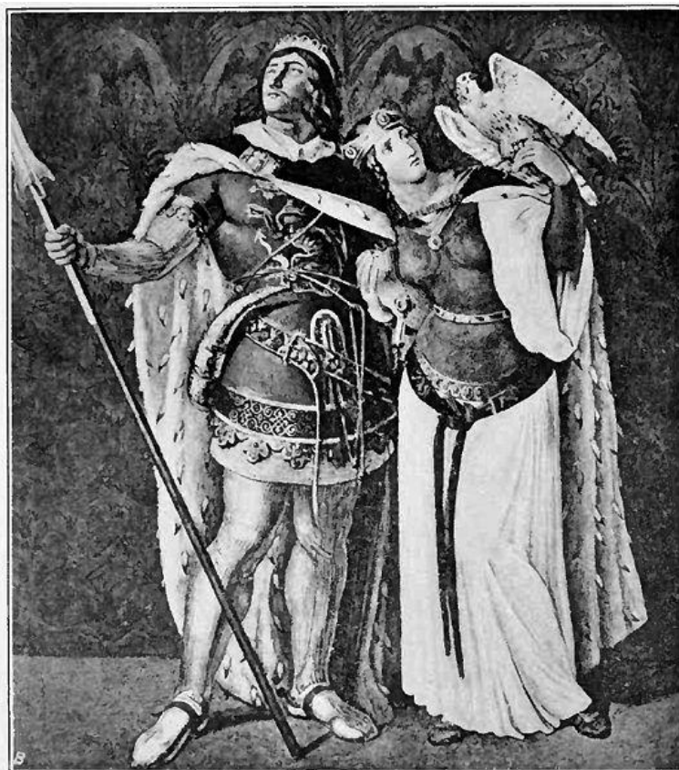
ジーフリトとクリエムヒルト (Wikipedia; Nibelungenliedより引用)