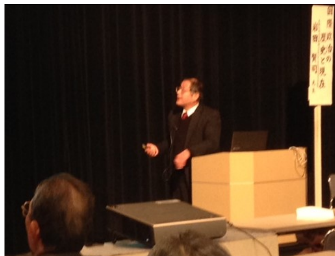
TSS 文化大学で講演する著者

国際政治学と安全保障論の観点から平和を中心に国際政治の歴史と現在について考察する。第二次大戦後のソ連を中心とする社会主義東側陣営とアメリカを中心とする資本主義西側陣営の対立のドラマ、いわゆる第三次世界大戦に至らず結果として長い平和となった「冷たい戦争」としての東西冷戦をめぐる平和と国際政治について、さらに東西冷戦終結後の平和と国際政治について解説し、平和が冷戦時代の超大国支配や冷戦終結後現在の地域大国主義に左右される国際政治からどのような影響を受けているのか、そして平和な生活への影響を最小限にする方策は何であるのかについて、対立激化、緊張緩和、二極支配、一極支配、多極化などのキーワードを用いて考察する。