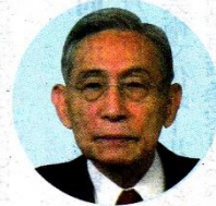
牟田 泰三 (広島大学元学長、物理学者)

孫娘(アヤ)が2歳10カ月のある日のこと、二人で散歩していて、私がちよつと疲れただけでベンチに「ひと休み」と言つて腰掛けていたら、アヤが「ジイジ、もう帰ろうか」と言うのです。この子はジイジ